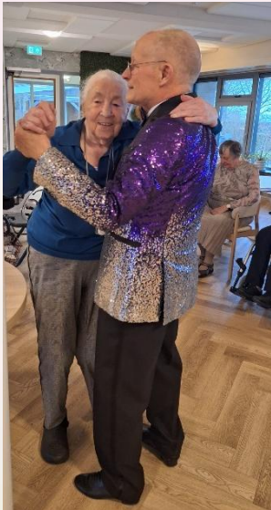
Er werd volop gedanst tijdens het mooie optreden van het Ballroom Dansteam Sneek