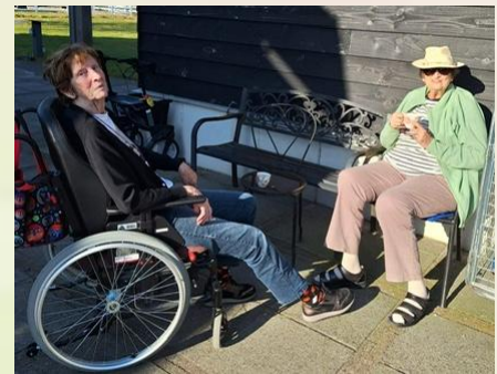
Heerlijk, het is al LENTE in maart, gezellig buiten zitten en genieten van het zonnetje!